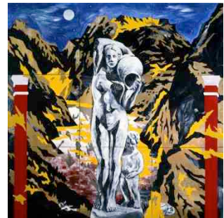
《谷間の泉》 1986年 セラミックに釉染 大塚オーミ陶業株式会社+作家蔵