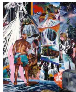
《交感神経と副交感神経の結婚》 1991年 キャンバスにアクリル 星野眞朋氏蔵

読者プレゼント用チケット (5組10名様分) をご希望される方は にチェックを入れてください。 希望する