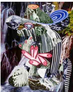
《芸術の浄化》 1990年 キャンバスに油彩 徳島県立近代美術館蔵