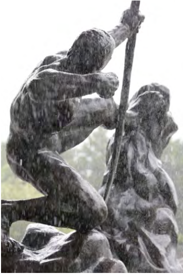
1 エミール=アントワーヌ・ブールデル 《弓を引くヘラクレス》2015年