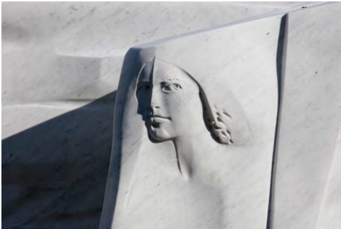
4 ジュリアーノ・ヴァンジ 《偉大なる物語》2015年