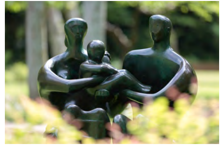
3 ヘンリー・ムーア 《ファミリー・グループ》2015年