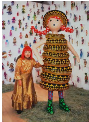
5 草間彌生 2004年