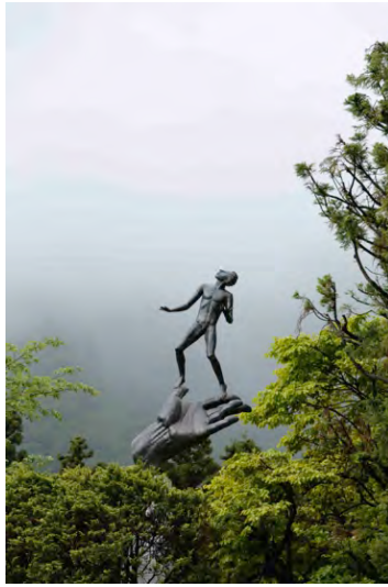
2 カール・ミレス 《神の手》2015年