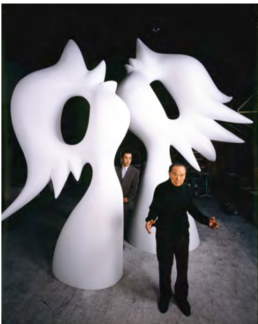
7 岡本太郎 1993年