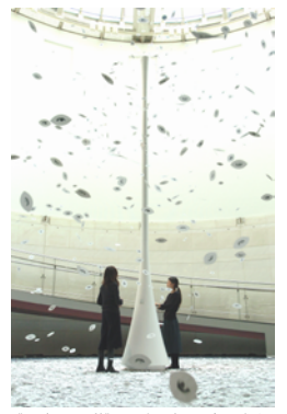
《まばたきの葉》2003年