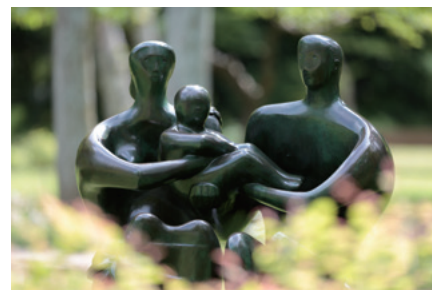
ヘンリー・ムーア《ファミリー・グループ》

彫刻の森美術館に展示されている彫刻作品。ヘンリー・ムーアをはじめ、エミール=アントワヌ・ブールデル、カール・ミレス、ジュリアーノ・ヴァンジなどの当館を代表する野外彫刻の数々が、四季折々の箱根の大自然と調和しながら展示されています。