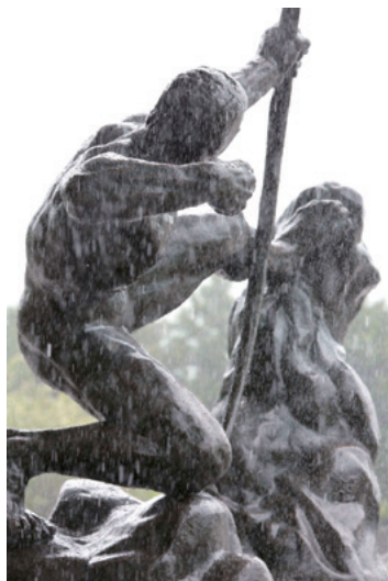
エミール=アントワヌ・ブールデル《弓を引くヘラクレス》