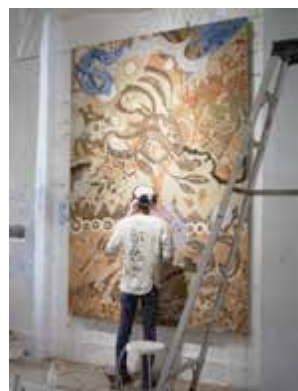
《世界の根っこにある大切な唄》

会期初めの9月20日～24日に制作された新作《世界の根っこにある大事な唄》。今回展示されている作品群を集約したような作品。土以外に青いアクリル絵の具も使用され、作家の制作の変化も感じられる作品となっています。公開制作はアトリエにて12月19日（土）にも開催されます。