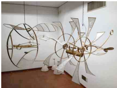
《サウンド・オブジェ》2014年