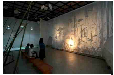
《Sound Theater》2015年