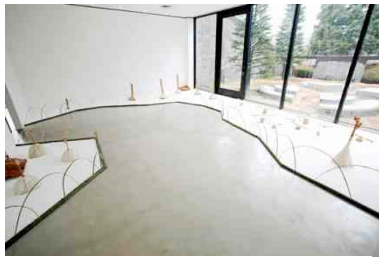
《Sound Garden》2015年