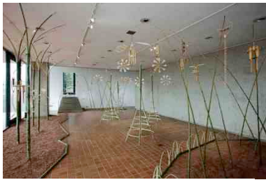
《Sound Forest》2015年