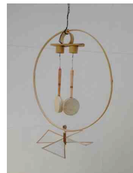
《サウンド・オブジェ》2014年