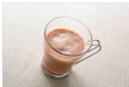
DOMORI チョコレートドリンク 500円