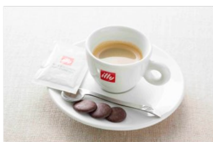
illy エスプレッソ (with DOMORIカカオ) 400円