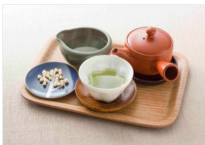
日本茶セット 500円 (14:00-16:30)