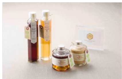
クインシーガーデン (メープルシロップ 1,500円、ビュアはちみつレモン希釈タイプ 1,400円、メープルシロップ 1,400円、メープルシロップ - 1,200円)