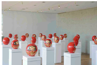
しりあがり寿 《回転体は行進するダルマの夢を視る》 2014年