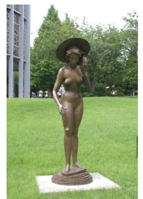
海辺を歩く少女 1985-93年 204×65×75cm ブロンズ 彫刻の森美術館蔵