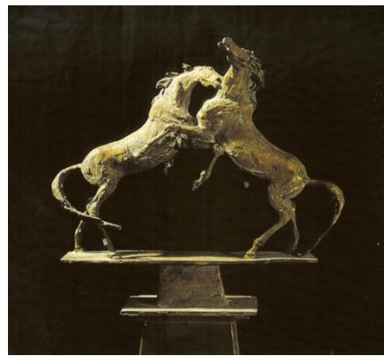
3 戦う馬 1940年 23×25×6cm ブロンズ