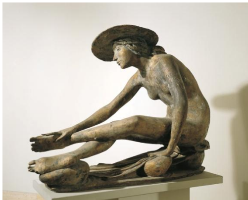
2 岸辺の娘 1934年 85×110×35cm ブロンズ