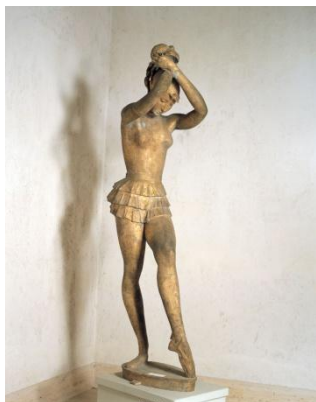
1 ダンスを学ぶ女性(大) 1972年 195×47.5×73cm ブロンズ