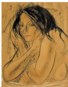
4 ポーズをとるモデル 1977年 34.5×20cm 鉛筆、チョーク