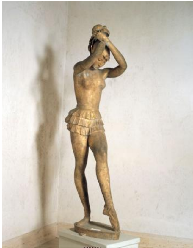
ダンスを学ぶ女性(大) 1972年 195×47.5×73cm ブロンズ

彫刻の森美術館では、ヴェナンツォ・クロチェッティ(1913～2003)の生誕100年を記念して、「生誕100年記念 ヴェナンツォ・クロチェッティ展」を開催します。最初期から晩年の彫刻と素描33点を展示し、60余年にわたる創作の軌跡を展望します。