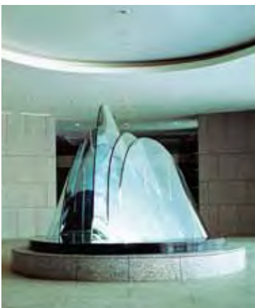
《澤》 熱線反射ガラス、御影石 1991年 w550×d350×h240cm 所蔵:東京都庁舎議会議事堂