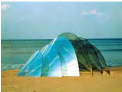
《相》 熱線反射ガラス 1989年 w372×d276×h165cm 所蔵:東京都現代美術館