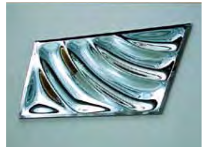
《超時空》 ガラス鏡、ステンレス 2002年 w250×d11×h140cm 所蔵:ピュレックス京橋