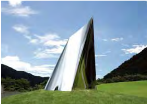
《座標》 ステンレス 2009年 w122×d102×h175cm