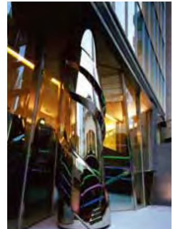
《GALAXY》(2005年) ビュレックス麹町・東京