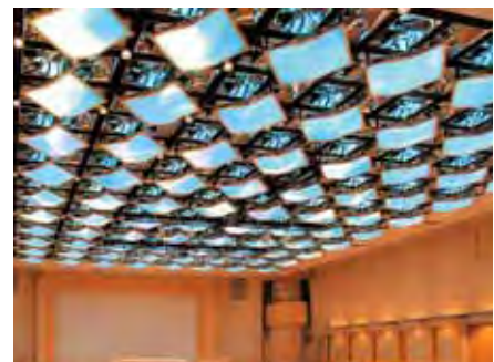
《彩雲》(2008年) 帝国ホテル光の間・東京