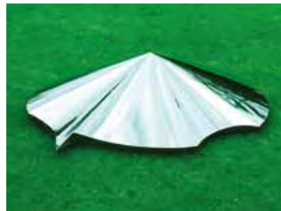
《SUN'91》 ステンレス 1991年 w245×d180×h45cm