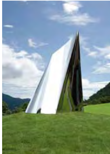
《座標》 ステンレス 2009年 w122×d102×h175cm