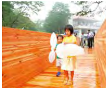
長さ11メートルの木橋は、ネットの森と同じ大断面集成材が用いられている。