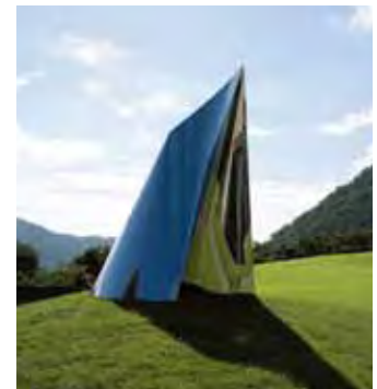
《座標》 2009年、ステンレス

ステンレスやガラスなどを用いた抽象彫刻をはじめ、公共空間における光の造形や壁面作品なども手がけている多田美波の創作活動を紹介します。本展覧会は、新作を含む彫刻24点を中心に、野外彫刻や建築関連作品の写真パネルも展示し、光を追い求めた彫刻家、多田美波の芸術世界を検証しようとするものです。