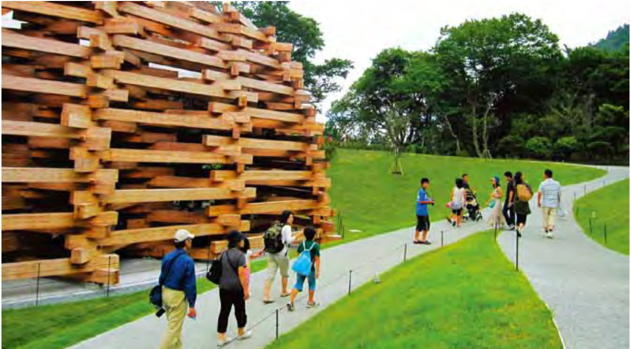
エリアを行き交う来館者。思い思いのルートで散策できるようになり、楽しみ方も広がった。

1969年の開館以来、緑の中のアートミュージアムとして親しまれてきた彫刻の森美術館は、今年8月1日に開館40周年を迎えました。ゴールデンウィークの5月2日に、子どもたちが遊びを通して作品を感じることができるプレイ・スカルプチャー「ネットの森」がオープン。さらに開館記念日の8月1日には、ネットの森からピカソ館をつなぐ橋を架ける見学ルートが新設され、来館者は館内全体を周遊できるようになりました。